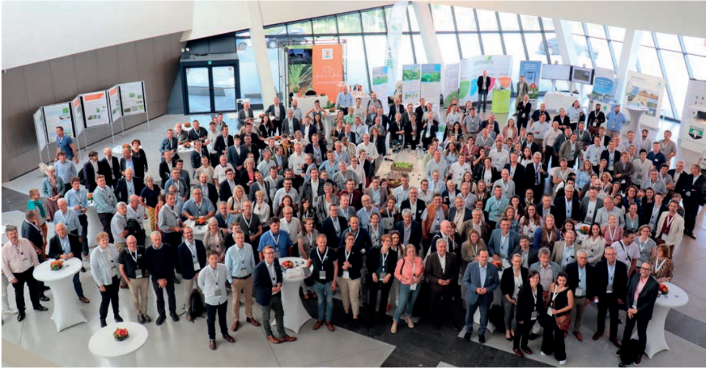
IIRB-kongres nummer 78 løb af stablen i den belgiske by Mons midt i juni. Der var 320 deltagere fra 20 forskellige lande, herunder med deltagelse fra NBR.