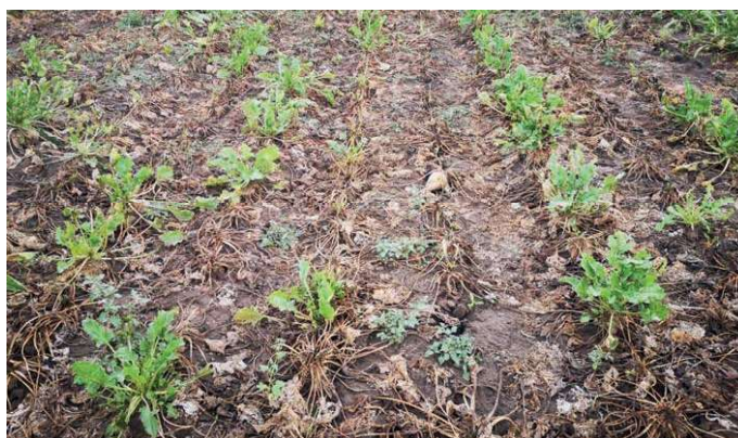
Foto 3. Foto viser symptomer af SBR-RTD i de serbiske sukkerroemarker. Sygdomskompleks er ofte forårsaget af patogen bakterie: Candidatus Arsenophonus phytapathogenicus og Candidatus Phytoplasma solani .

To indlæg omhandlede SBR & RTD af hhv. Pierre Longerstay fra SESVanderHave og Bojan Duduk fra det serbiske institut for pesticider og miljøbeskyttelse. SBR er såkaldt 'Syndrome Basses Richesses', og RTD er 'Rubbery Taproot Disease', og begge sygdomme er ofte fundet sammen som et sygdomskompleks. SBR-RTD er forårsaget af to forskellige patogener