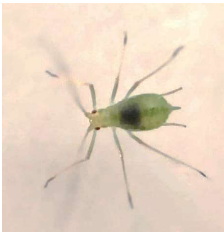
Foto 4. Billede af ferskenbladlus med såkaldt 'sort mave'. Den sorte mave på bladlusene indikerer, at den har suget på plantemateriale med MPR, og disse bladlus dør sandsynligvis indenfor kort tid. Dette fænomen er meget brugbart i lusestudier med MPR. Kilde: Sharella Schop, Wageningen universitet, Holland. (præsentation fra IIRB-kongres 2024).

I de senere år er sygdommene også fundet i Tyskland. Vores naboer mod syd ser meget alvorligt på denne sygdom og har iværksat et samarbejde for at undersøge sygdomskomplekset og se på mulige løsninger til det. Da sygdommene overføres af cikader, er det selvfølgelig vigtigt at monitere og bekæmpe denne skadegører, men forældre prøver også at løse problemet med det genetiske materialer i sorterne. Forælderne har allerede identificeret noget genetisk materiale, som bedre kan tåle SBR-RTD, og de arbejder på udvikling af nye resistente sorter. Hos NBR kommer vi til at monitere indflyvning af cikader og følge udvikling af SBR-RTD nøje, da sygdommene breder sig mere og mere nordpå fra Sydeuropa.