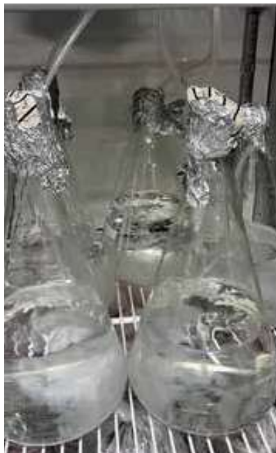
Aphanomyces-zoosporer. Framställning av Aphanomyces-zoosporer som används för att infektera plantor i krukor för utvärdering av tolerans.

En sista del i det svenska projektet genomförs av SLU, som ska studera hur olika biologiska preparat kan minska Aphanomyces-angrepp tidigt på säsongen.