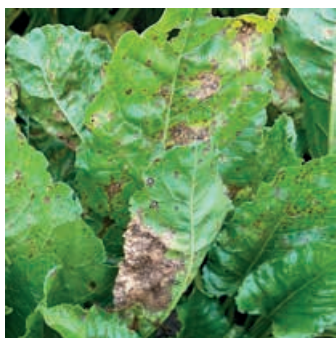
Foto 1. Symptomer af Cercospora ses som bladpletter med mørk kant og lysere midte. Bladpletterne vokser efterhånden sammen til visne områder på bladet (venstre).