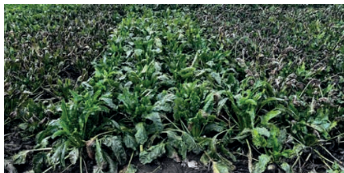
Foto 3. Pilotforsøg med Cercospora-smitte 2025. I midten af billedet ses fire rækker med en tolerant sort, der tydeligt har mindre angreb og grønnere top i forhold til naboparcellerne, hvor der er sået sorter fra sortslisten, og som ses at blive kraftigt angrebet af Cercospora.

håndterbare. I år er der set angreb i hele det svenske dyrkningsområde, og også ikke-vandede marker er blevet hårdt ramt, selvom tendensen stadig er kraftigere på vandede marker.