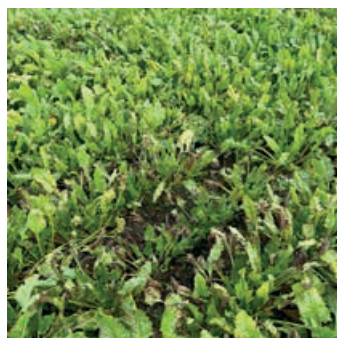
Foto 2. Ofte har vi set angreb af Cercospora i mindre områder i marken, der visner ned. I 2025 så vi i nogle marker udbredte angreb.