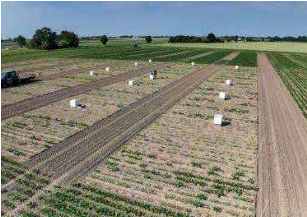
Foto 1. Måling af lattergas i kvælstofgødsningsforsøg hos NBR i 2024.

under givne forhold kan der opstå høje emissioner indenfor korte tidsintervaller. Hos NBR anvender vi kamre til at estimere emission af lattergas (foto 1). Disse placeres kortvarigt (typisk 60 minutter) i en ramme, der er sat ned i jorden, hvorefter lattergasemissionen kan kvantificeres ved at måle ændringen af lattergaskoncentration i løbet af måleperioden. Koncentrationen af lattergas bestemmes ved at udtage små luftprøver, som analyseres ved hjælp af gaskromatografi. NBR har dog netop investeret i en laser-baseret gasmåler, hvor man direkte kan aflæse koncentrationen i kammeret.