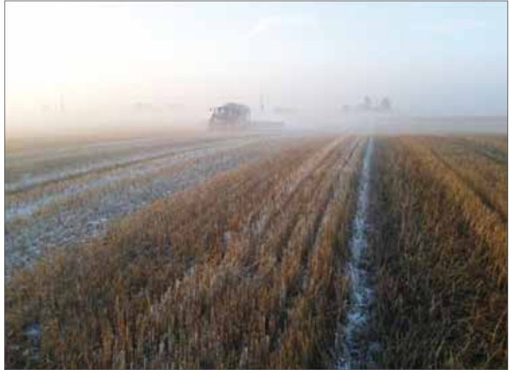
Spridning av släckt kalk en tidig morgon hösten 2013.