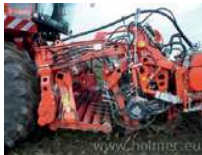
Billede 4: Optagerenhet HR fra Holmer er blevet tildelt sølvmedalje på Agritechnica for modulophængt rækkeenhed.