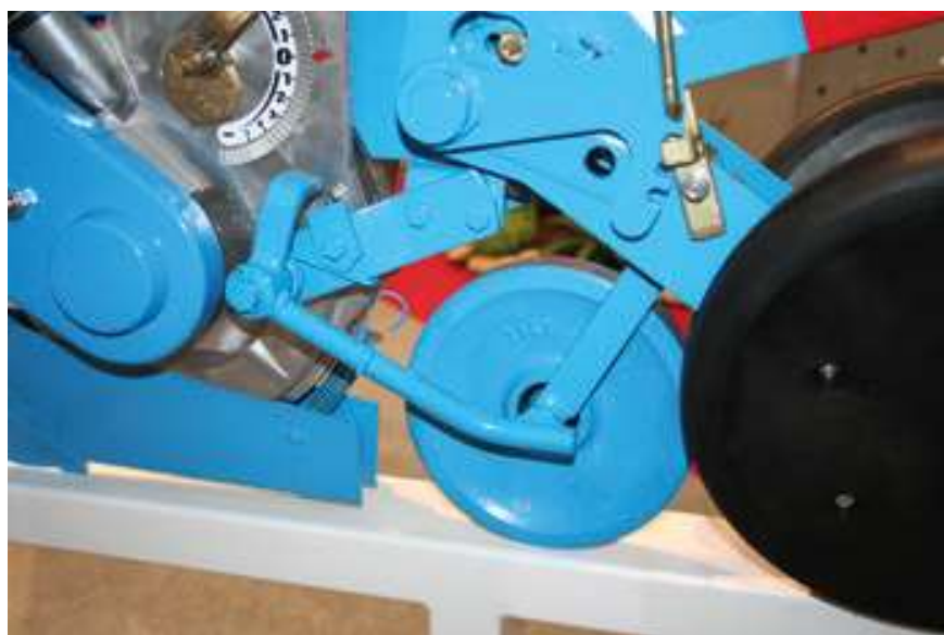
Billede 2: Sånhed fra Monosem, med kraftigt mellemtrykrulle.