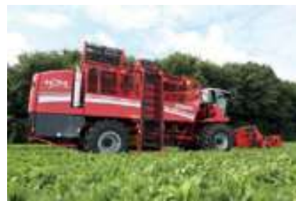
Billede 3: Grimmes nyeste roeoptager, Rexor 620, er blevet udnævnt som årets maskine 2010.

På Agritechnica blev der uddelt fem guld- og 28 sølvmedaljer af arrangørerne (DLG). En af sølvmedaljerne gik i år til Holmer for deres modulopbyggede optageraggregater, HR (billede 4), som betyder, at hvert aggregat uafhængigt af de andre følger ujævnheder i marken for eksempel som følge af sprøjtespor. Dette bevirker en mere præcis optagning, hvilket endvidere ifølge Holmer giver en markant brændstofbesparelse og en vægtbesparelse på 400 kg. ■